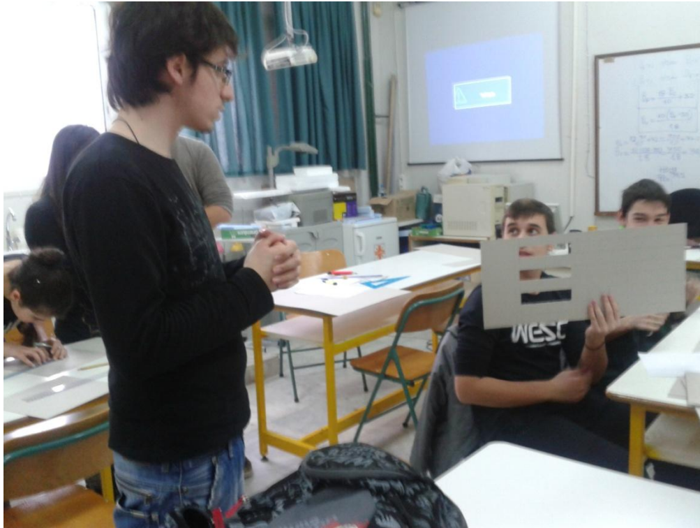
2013-2014: Καλά μετρήσαμε;